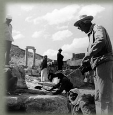
Prof. Kazimierz Michałowski